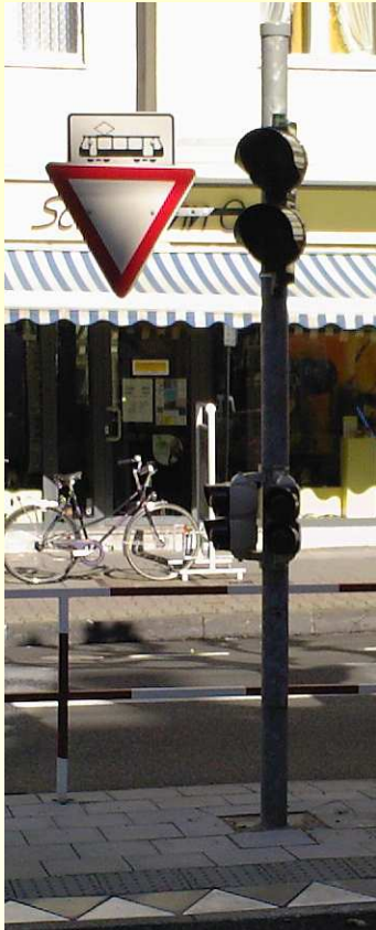
Signalmast mit Warnschild

Ingenieurgesellschaft für Betriebstechnik mbH