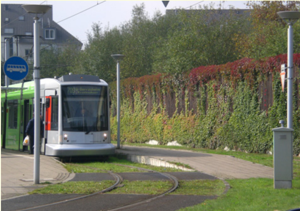
Anfang Schleife der Endhaltestelle Gerresheim Krankenhaus

Im Rahmen des Konzeptes Abstellanlagen der Rheinbahn soll im Bereich der Schleife Endhaltestelle Gerresheim Krankenhaus zur Überwachung von möglichen 9 Abstellmöglichkeiten für nachts abgestellte NF8U-Straßenbahnfahrzeugen eine Videoanlage errichtet werden, um ein sicheres Abstellen der Fahrzeuge zu gewährleisten und möglichen Vandalismusschäden vorzubeugen.