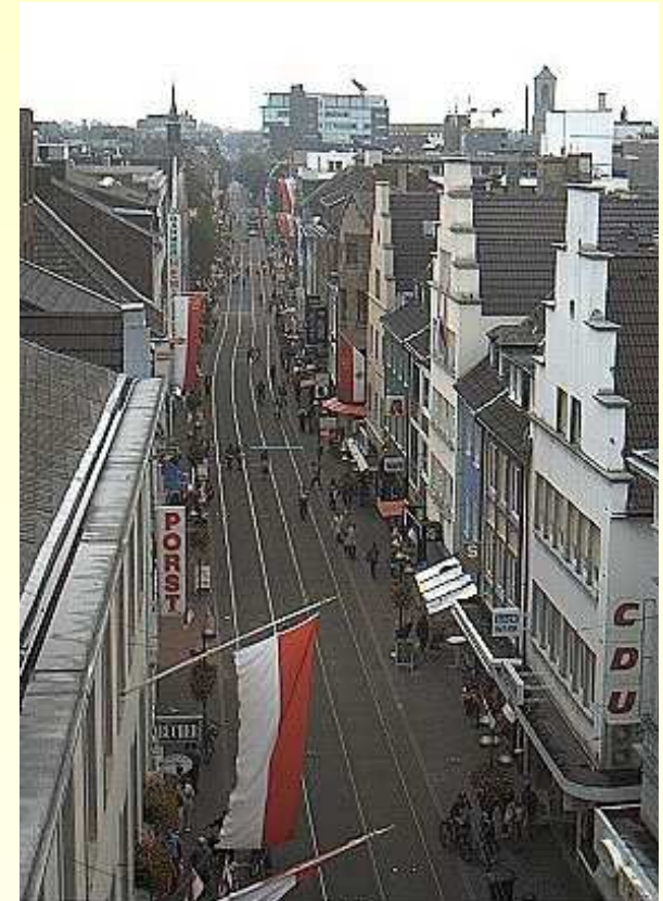
Der Hauptstraßenzug

Der Leistungsumfang der bt-plan beinhaltete die Planung und Bauüberwachung der Technischen Ausrüstung mit den Gewerken Fahrleitungsanlagen, Niederspannungsversorgung einschl. Weichenheizungsanlagen, nachrichtentechnische Ausstattung einschl. dynamischer Fahrgastinformation sowie Sicherungs- und Signalanlagen.