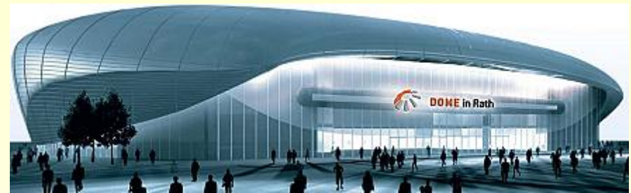
Eisarena „ISS Dome“

Der Streckenabschnitt wird über ein neues Unterwerk versorgt. Dieses speist eine Hochketten-Fahrleitung. Die Haltestellen werden mit Beleuchtungs-, Informations- und Sicherheitseinrichtungen ausgestattet. Ein Leitstand im Haltestellenbereich „Dome“ ermöglicht für Disponenten eine optimale Organisation der Beförderungsleistung im Veranstaltungsfall.