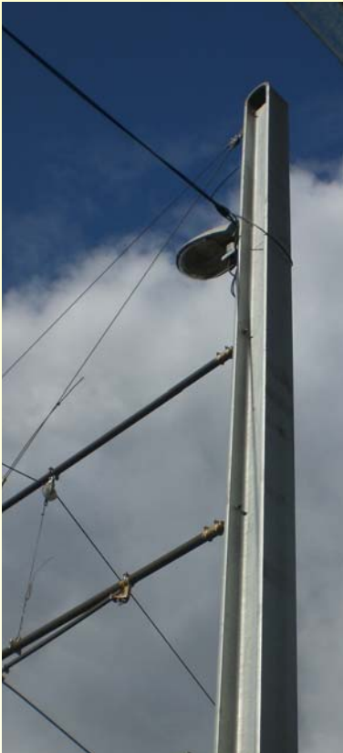
prov. Leuchte am Fahrleitungsmast

Ingenieurgesellschaft für Betriebstechnik mbH